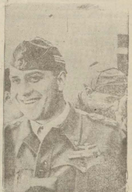
İtalya Hacıye Nazırı Kont Ciano'nun Belgradı ziyareti ettiği zaman alınmış resimlerinden

Londra 25 (Hususi) — İskodradan Tirana dönen Kont Ciyano bugün Romaya avdet edecektir. Dün, İtalya nafta ve maarif nazırları da Tayyare ile Tirana gelmişlerdir. İtalyanın almak istediği vaziyet eski müphemiyetini muhafaza etmektedir. Bununla beraber, yarın Musolininin toprak bayramı münasebetile söyleyeceği nutuk alâka ile beklenmektedir. Muharebenin bidayetindenberi hiçbir söz söylememiş olan İtalyan Başvekilinin yarınki nutkunda da İtalyanın vaziyetini tasrih edeceği şüphelidir. Yalnız İtalya ile müttefikler arasındaki münasebetlerin düzeltilmekte olduğunu gösteren âlâmetler vardır. Bir defa Fransa ile İtalya (DEVAMI 3 üncü sahifede)